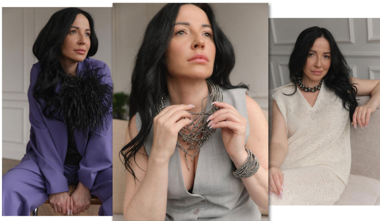
Владелица бренда CHARLE