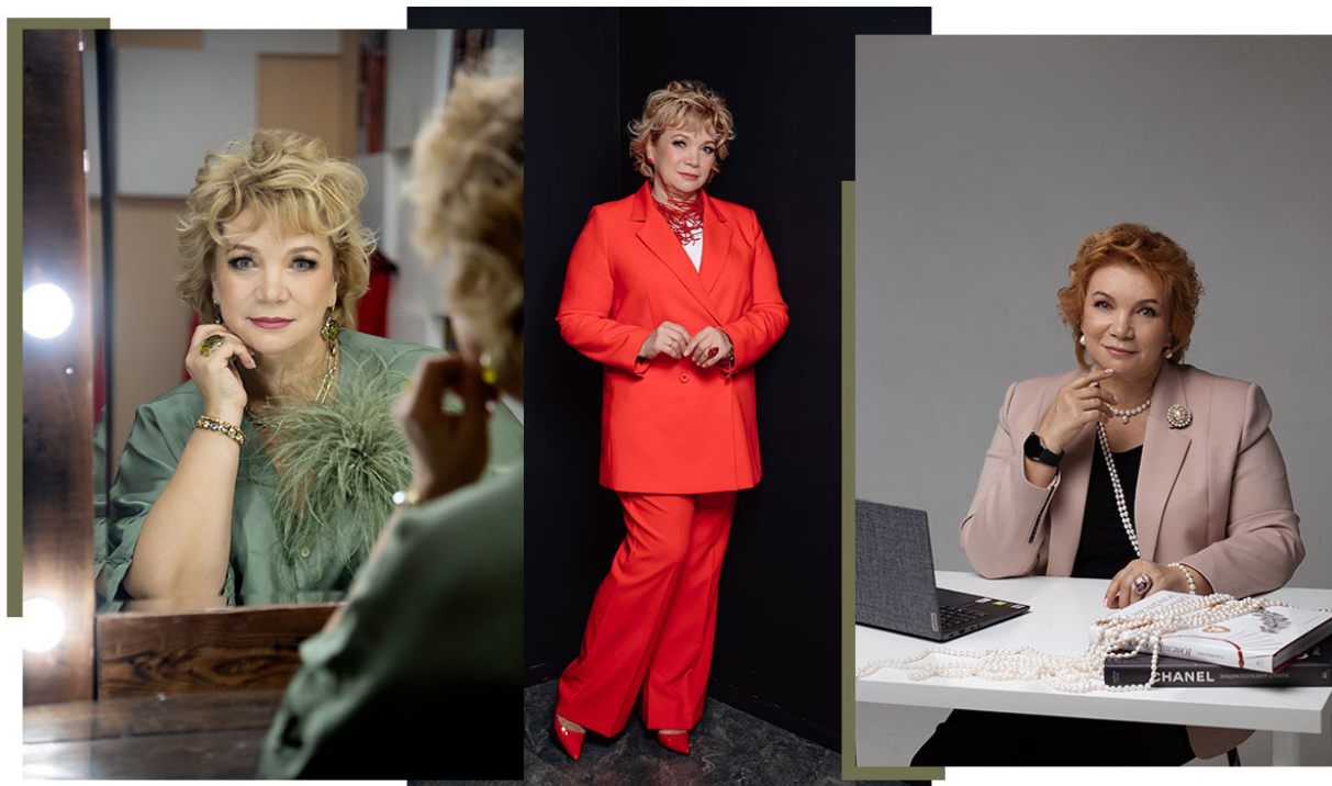
Основатель бренда «Шкатулка», Казахстан, г. Павлодар