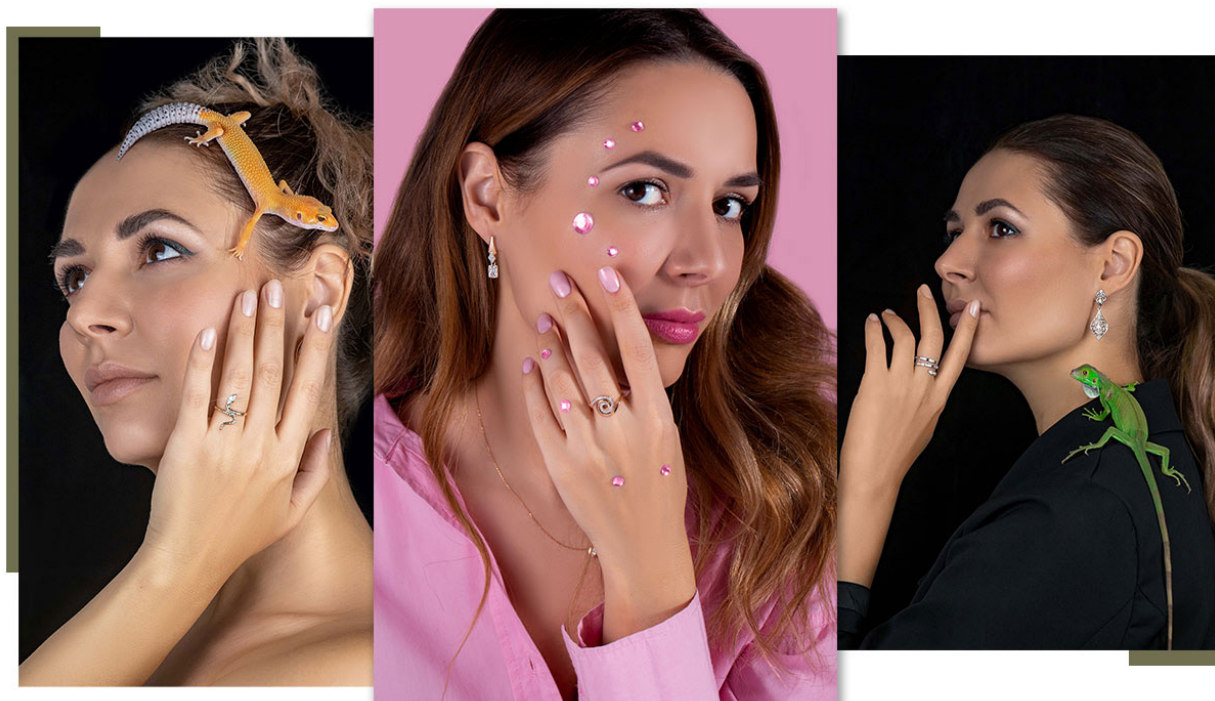
Маркетолог компании Atoll jewelry