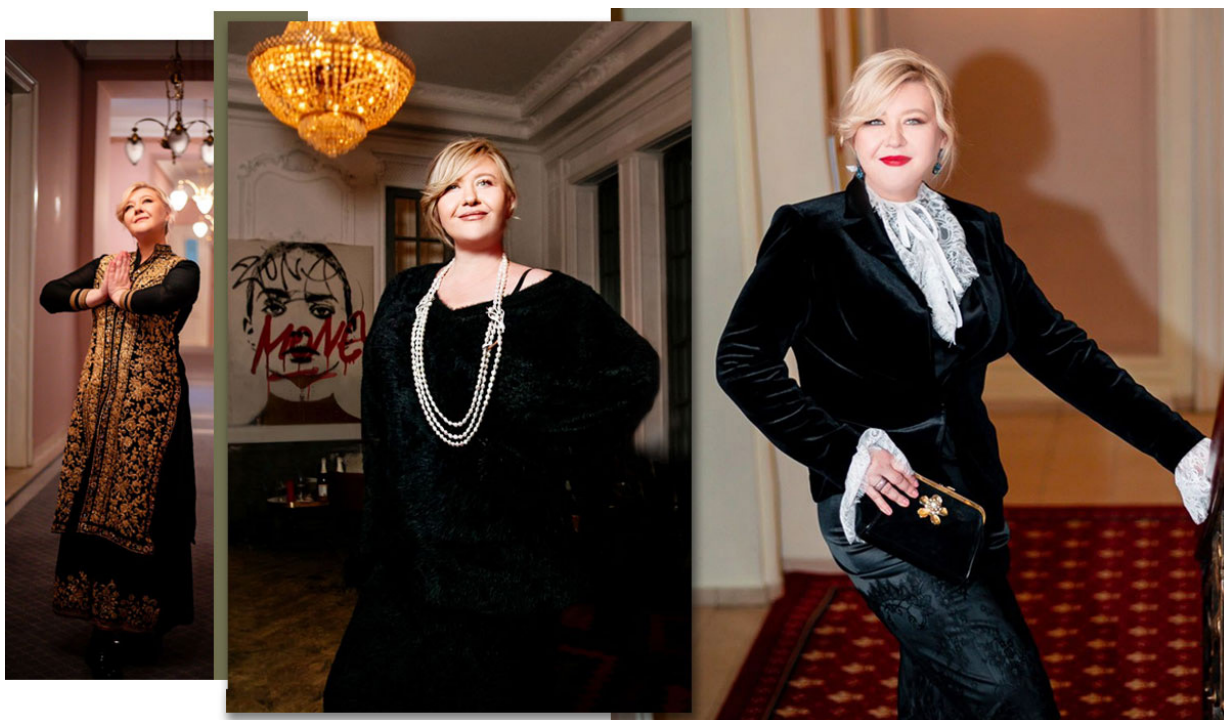
Владелица Fresh Jewelry