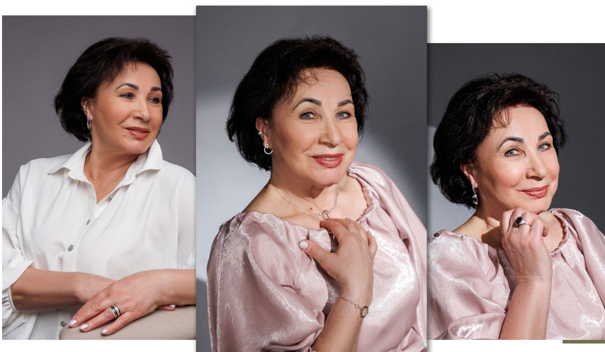
руководитель отделения квалификации POKROSKY JEWELRY