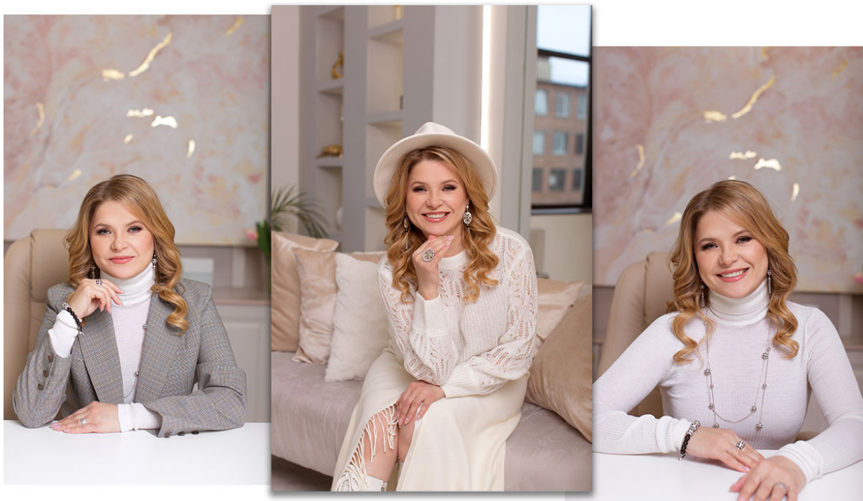
Владелица ювелирных бутиков “Элита” на Алтае