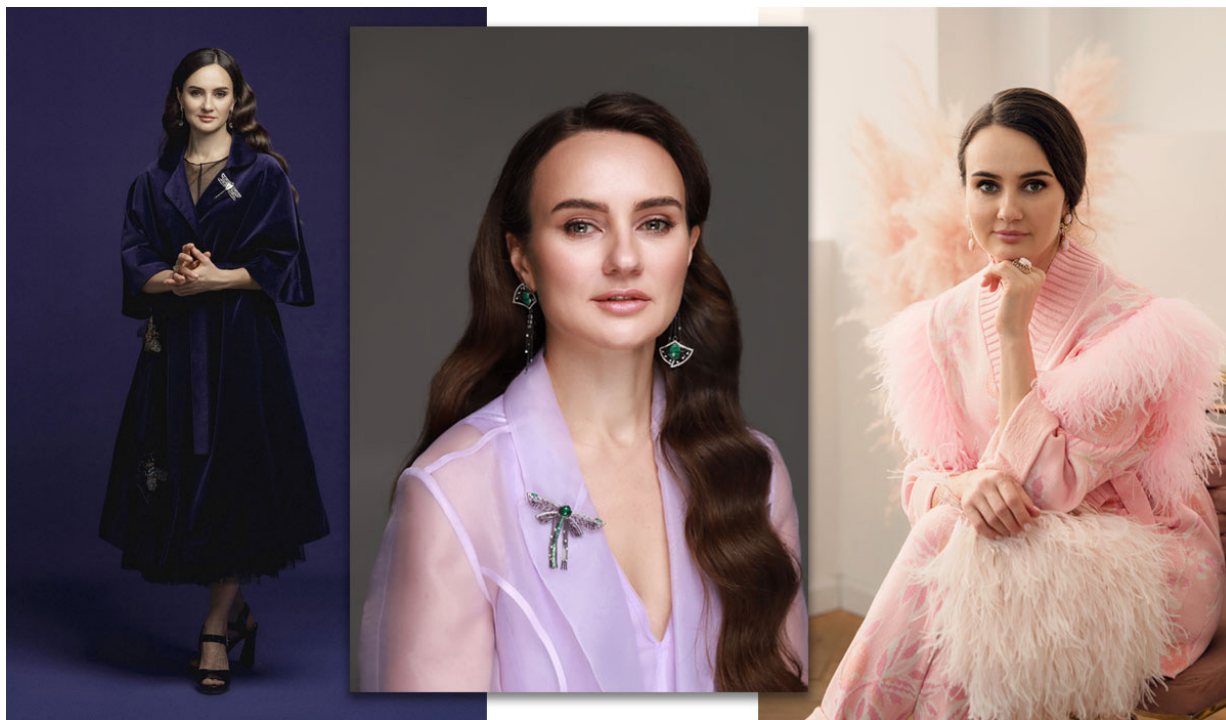
Основательница ювелирного бренда Natasha Libelle